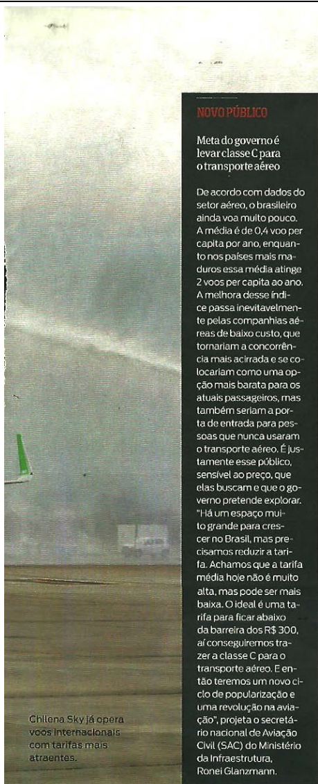
Chilena Sky já opera voos internacionais com tarifas mais atraentes.