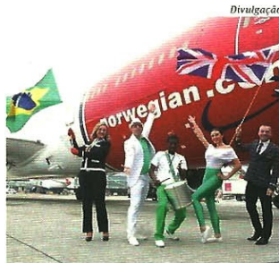
Norwegian voa entre Londres e o Rio.

ros, onde a média fica em 22%, casos de Estados Unidos e Europa. Parte desse custo é consequência do ICMS cobrado pelos estados nos voos domésticos — o Brasil é o único país do mundo onde há a tributação regional sobre o combustível e, por questões de reciprocidade, somente há isenção para voos internacionais, de companhias nacionais ou estrangeiras. Cada unidade da federação tem sua própria alíquota de ICMS e para tentar atrair novos voos, os governos estaduais têm firmado acordos com as empresas para a redução do tributo, desde que novos voos e destinos sejam garantidos. Em São Paulo, o maior mercado do país, o imposto caiu de 25% para 12%. No Paraná, de 18% pode chegar a 7% dependendo da contrapartida das companhias. Esse movimento dos estados tem aumentado o número de voos, inclusive regionais, e barateado o custo