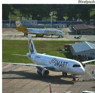
JetSMART começou a operar em dezembro.