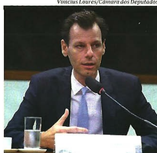
Vinicius Loures/Câmara dos Deputados